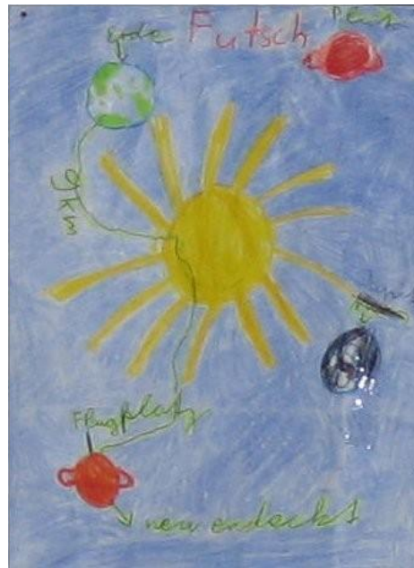
Navigationskarte für Wesen, die sich über Farben orientieren

Manchmal mussten wir eine Figur in einen oder anderen Punkt der Geschichte anpassen, damit eine intelligente und schlüssige Lösung gefunden werden konnte, aber das kam eher selten vor. Glücklicherweise waren die Figuren bereits von Anfang an so ausgelegt, dass sie sich ergänzen und wie von selbst gefunden werden und den Raum trotz aller Unterschiedlichkeiten gerecht geteilt und „verhandelt“ haben.